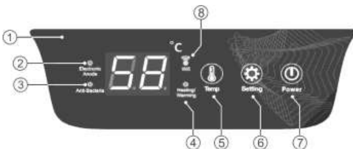
2. slika. Digitalni upravljački panel